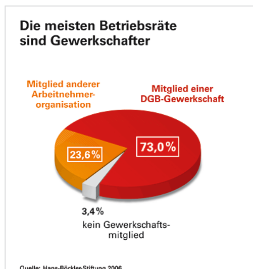
Abbildung 1: Bindung zwischen Betriebsrat und Gewerkschaft

Vorweg vielleicht ein paar kurze Erläuterungen zum besseren Verständnis. So wie beispielsweise der Staat die Notwendigkeit so genannter „antizyklischer Investitionsformen“ vornehmen muss, gibt es ähnliche Vorgehensweisen eben auch in allen wirtschaftenden Unternehmen. Darin ist immer auch eine Komponente der „Social Competence“, also der Sozialkompetenz, enthalten. Wie stark diese Komponente ist hängt auch ein wenig vom allgemeinen Sozialgeschehen im jeweiligen Staat ab. Und momentan haben wir eine solche Phase, in der viele Unternehmen zunehmend auf ihre soziale Wahrnehmung in der Öffentlichkeit achten. Diesen Trend gilt es zu nutzen. Deshalb setze ich meine (schon sehr breiten) Verbindungen in die deutsche Unternehmenslandschaft ein. Dabei suche ich den Kontakt weniger zu Unternehmensleitungen, als viel mehr zu Betriebsräten, die sich mit ihren Belegschaften weitaus besser auskennen und ihnen auch emotional viel näher stehen.