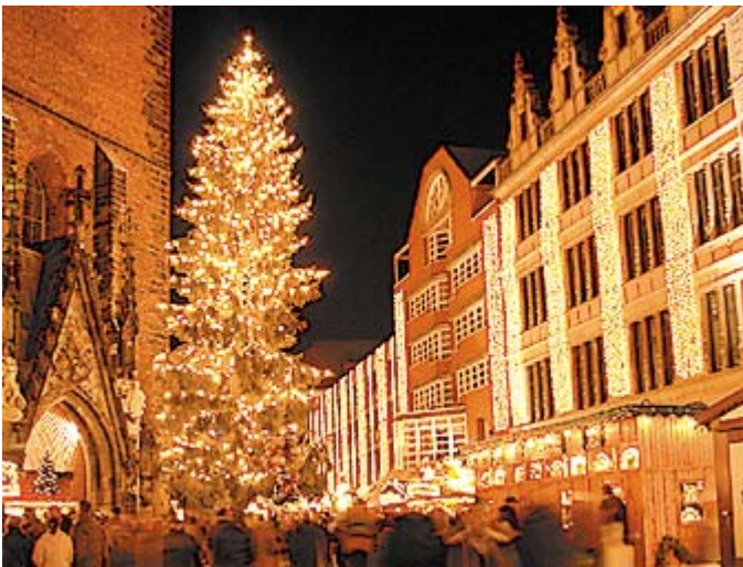
Abbildung 4: Der Weihnachtsmarkt rund um die Marktkirche in der Altstadt von Hannover

Diese Gründe haben mich dazu bewegt, den Neustart in Schengen, der für den 15. Januar 2009 geplant war, zu Gunsten der Organspende-Tournee zu verschieben. Der Neustart in Schengen wird jetzt am 15. April 2009 sein. Die Zeit bis zum Osterfest 2009 werde ich deshalb für meine Werbung für die Organspende nutzen können.