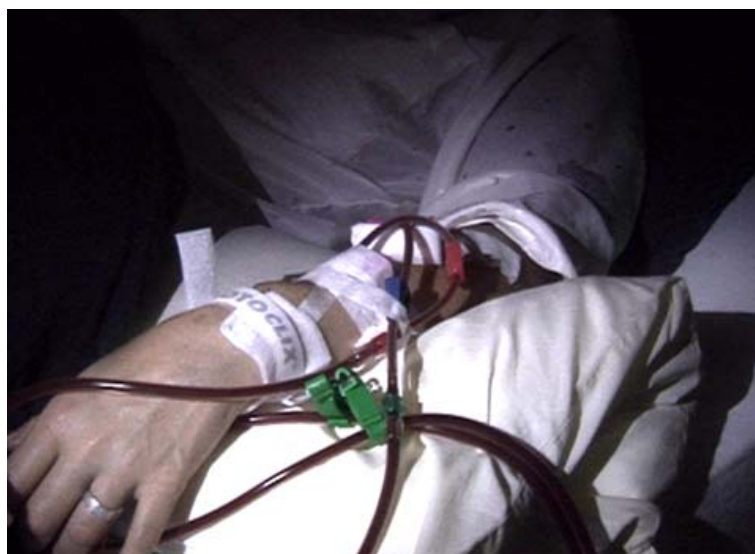
Abbildung 4: Organspender nach Entnahme der Organe

Sicher wird dieses Bild nicht nur auf Freude oder Zustimmung stoßen. Das ist mir klar. Und das verstehe ich auch. Trotzdem möchte ich meine Leser ganz einfach fragen, was daran als schlimm empfunden wird. Schreibt mir bitte eure Empfindungen und Meinungen. Meine Mailadresse lautet: drlruecker@aol.com - ich will mich gerne mit euch dazu auseinandersetzen oder eure Fragen zum Bild (aber auch zum Tod eines Menschen) beantworten.