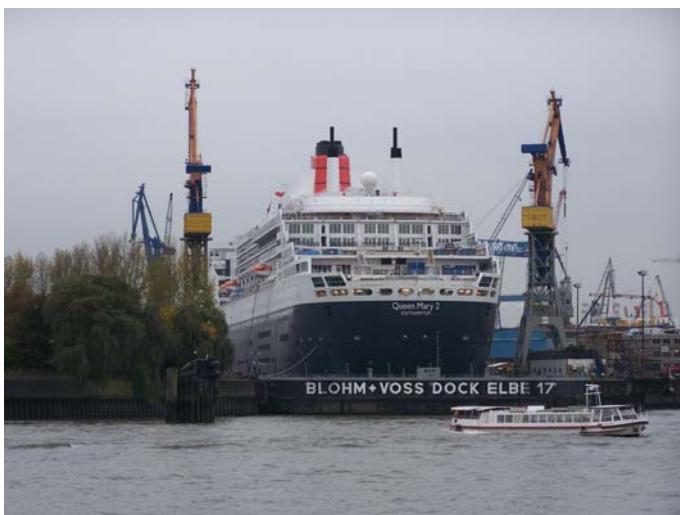
Abbildung 1: Queen Mary 2 im Dock Elbe 17 von Blohm + Voss in Hamburg