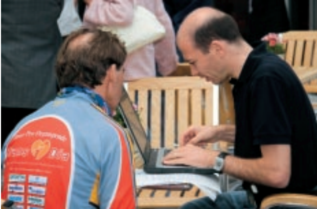
Bei der täglichen Pressearbeit

Stationen an: den Frankfurter Römer, das Universitätsklinikum Frankfurt/Main und das Offenbacher Klinikum. Unterwegs traf uns ein Kamerateam von Sat1. Wir mußten Ehrenrunden fahren bis alles im Kasten war.