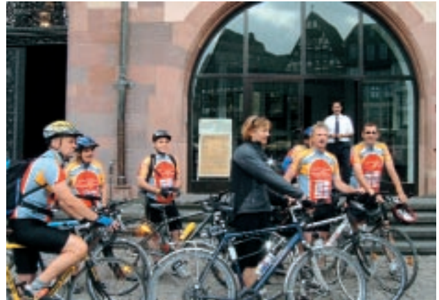
Vor dem Frankfurter Römer

Mit vielen Krankenpflegeschülerinnen haben wir unser Thema Organspende eingehend besprochen.