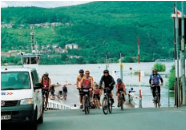
TransDia e.V. betritt Rheingauer Boden.