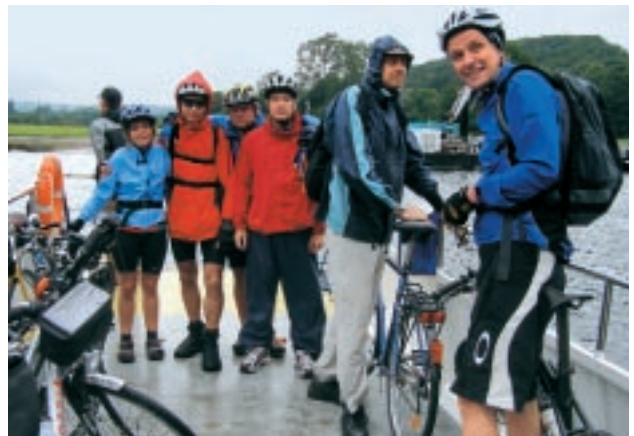
Es gibt kein schlechtes Wetter ...