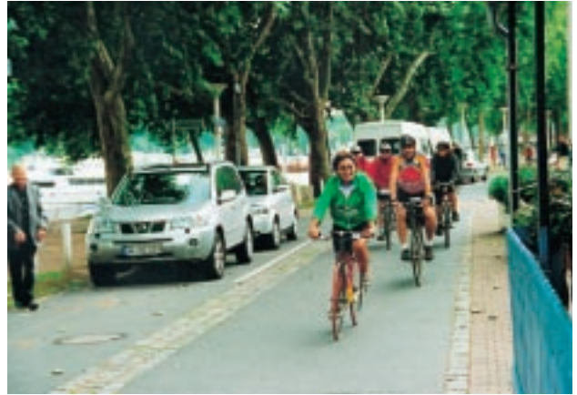
Zwischenstop am Schiersteiner Hafen: Bundesministerin a.D. Hannelore Rönsch führte die Truppe an.

Entlang des Leinpfades, landschaftlich schön gelegen, wollen wir Richtung Mainz. Da dieser Weg für Rennräder aber ungeeignet ist, führte uns Hannelore Rönsch mit ihren Ortskenntnissen durch reizvolle Weinberge.