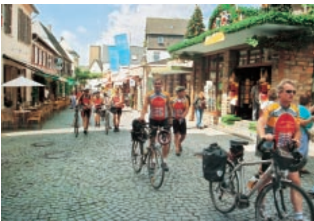
Schiebend, oberhalb der Drosselgasse