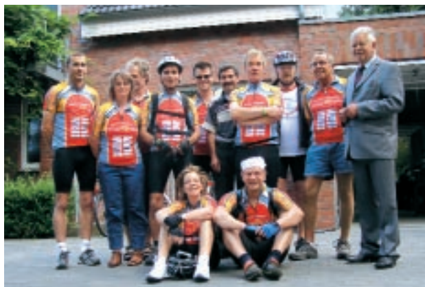
Der Start in Münster