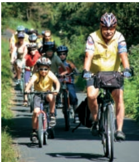
Jung und Alt sind dabei.