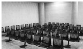
WARTEN AUF'S SPENDERORGAN - DEUTSCHLAND UND EU IM VERGLEICH HINTERGRUND SEITE 4