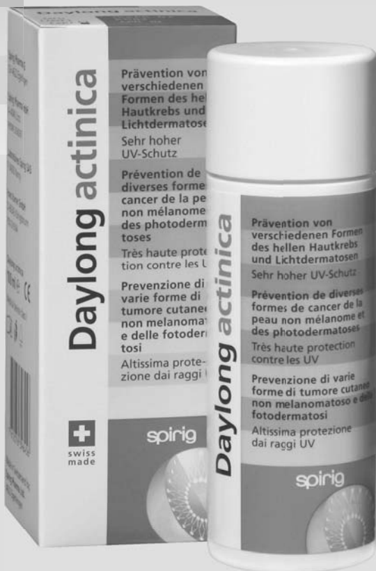
Daylong actinica®: Medizinprodukt der Klasse I zur Prävention von verschiedenen Formen des hellen Hautkrebs bei Risikopatienten.