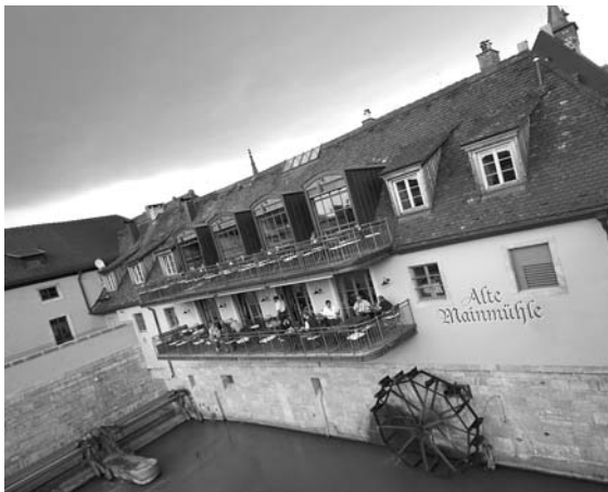
DIREKT ÜBER DEM FLUSS SPEISEN das besondere Flair der Alten Mainmühle

Das Backöfele liegt in der Ursuliner- gasse 3, in der Nähe des Rathausplatzes