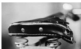
DIE ANDERE SICHT DER DINGE - HEUTE MIT DEM FAHRRADSATTEL SPORT SEITE 5