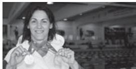
JUDIT BERENTE, PRÄSIDENTIN DER ETDGF IM INTERVIEW HINTERGRUND SEITE 3