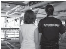
Therapiehaus Ludwigstraße 23 Tel. 0931-13366 www.therapiehaus-ludwigstrasse.de