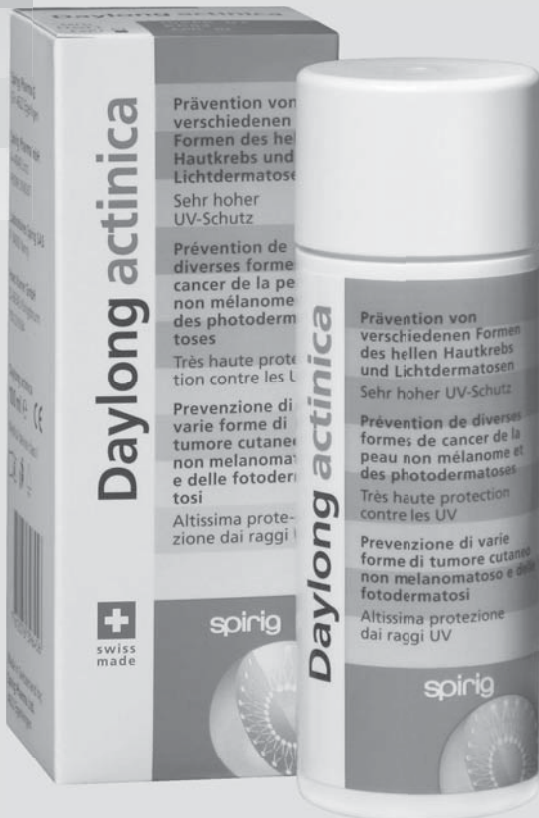
Daylong actinica®: Medizinprodukt der Klasse I zur Prävention von verschiedenen Formen des hellen Hautkrebs bei Risikopatienten.