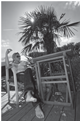
ENTSPANNUNG PUR unter Palmen

Direkt am Main gelegen, entfacht der neu angelegte Stadtstrand ein traumhaftes Urlaubs-Feeling. Auf einem bequemen Liegestuhl können die Gäste ihre Füße in den Sand stecken und unter Palmen einen kühlen Cocktail genießen. Der Main lädt zum Abkühlen der Beine ein. Diese Atmosphäre kennt man sonst nur aus dem Südsee-Urlaub. Seit 2006 können Sie auch hier in Würzburg das einzigartige Strandflair erleben und den Sommer in vollen Zügen genießen. Wer hier verweilt, bekommt auch kulinarisch Abwechslung geboten. Der Stadtstrand bietet sowohl Snacks, wie Pommes, Bratwurst und Eis, als auch feinste aufwändige und zugleich leichte Sommergerichte.