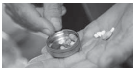
INFORMATIONEN ÜBER DIALYSE/LEBENDORGANSPENDEN HINTERGRUND SEITE 4