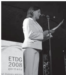
JUDIT BERENTE bei der Eröffnungsfeier

Judit Berente ist die Präsidentin der European Transplant and Dialysis Sports Federation (ETDSF). Sie kommt aus Ungarn, wo die ETD SF im Jahr 2001 gegründet wurde.